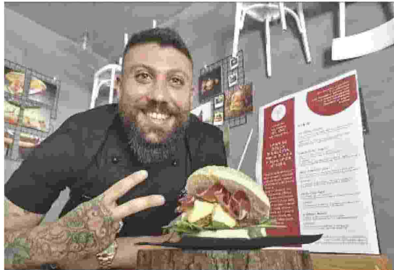
I panini sono diventati star della nuova ristorazione post-covid e della ripresa

Hanno sempre un'aria sbarazzina anche quando finiscono divorati durante un esclusivo galà. E nell'immaginario collettivo, sono divertenti, friendly, informali. Anche geniali: hanno la misteriosa capacità di risultare sempre un po' proletari, insomma il rimpiazzo di un autentico piatto a un prezzo più accessibile, ma da qualche tempo, anche aristocratici, non fosse altro che per avere vinto la ritrosia e la puzza sotto il naso che nei loro confronti avevano sempre avuto, in passato, chef stellati e maestri di cucina. Pura evidenza: le pizze si dovranno arrendere, sono i panini le nuove star della ristorazione nazionale. E adesso anche l'espressione di un cibo loquace, che sa parlare e comunicare. Dopo gli scossoni del lockdown servivano messaggi positivi che avessero la forza di arrivare al grande pubblico. E la Community del panino ha pensato bene di mobilitare i suoi numerosi aderenti attorno a un progetto ispirato alla "Rinascita" (peraltro ideato dall'Accademia Panino Italiano): creare versioni inedite del divertente food declinandole su parole dal forte